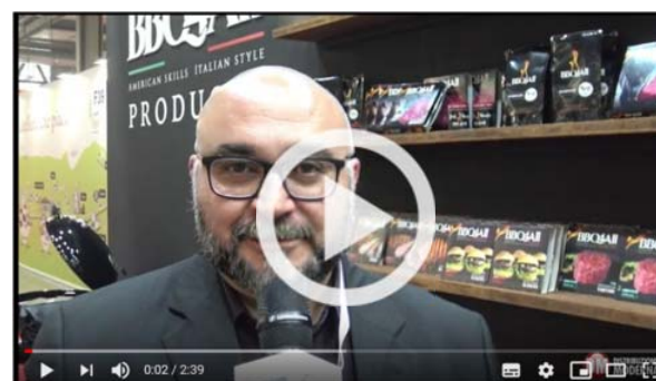
BBQ4All sbarca nel reparto carni della Gdo