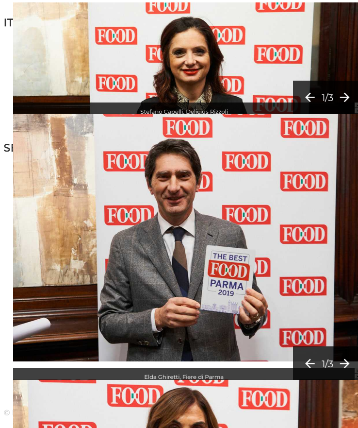
THE BEST FOOD PARMA 2019