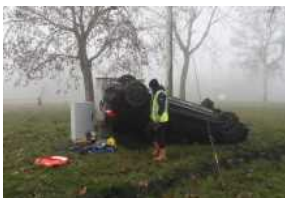
Incidente: l'auto si cappotta, il conducente fugge

Articoli correlati Altro dallo stesso autore