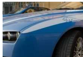
Trovato uno dei rapinatori responsabili del colpo da 46mila euro a "La Cassa" di Ravenna