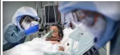
IL COVID-19 OGGI