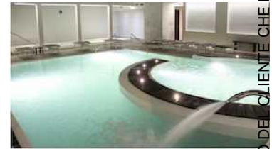
TURAN VASCA TERMALE IN-DOOR E OUT-DOOR