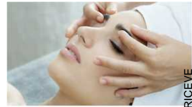
RENIGHT RECOVER TOUCH