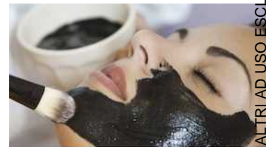
SKIN REGIMEN DETOX