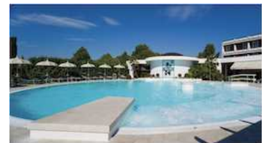
THESAN VASCA SALINA CLORATA TEMPERATA