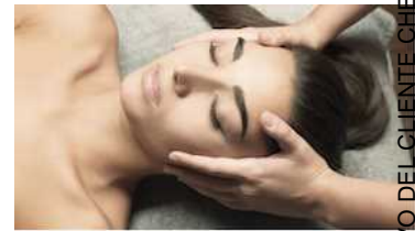
SUBLIME SKIN LIFT COMPLETE