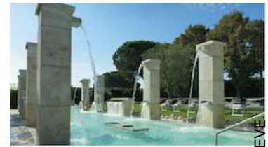
NETHUNS VASCA SALINA CLORATA TEMPERATA