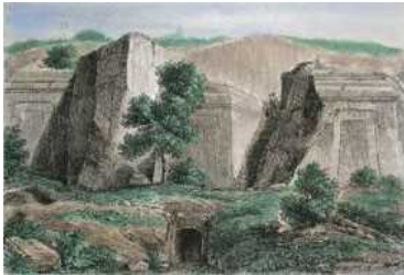
Norchia in una stampa del 1850

Viterbo, Strada Cimina, 14 Tel. 0761.324172 r.a. - Fax 0761.227414