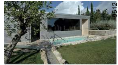
SAUNA PANORAMICA OUTDOOR