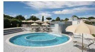
FERONIA VASCA SALINA CLORATA TEMPERATA