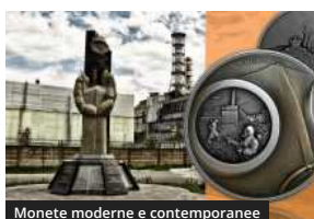
Monete moderne e contemporanee

CHERNOBYL 25 anni dopo: un RICORDO in moneta dei "LIQUIDATORI"