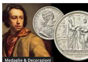
Medaglie & Decorazioni

650 anni della TORRE DI PISA: due monete-scultura dalle ISOLE COOK