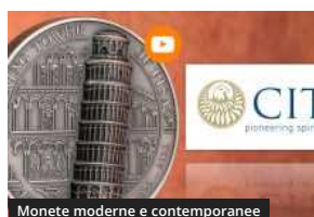
Monete moderne e contemporanee

CHERNOBYL 25 anni dopo: un RICORDO in moneta dei "LIQUIDATORI"