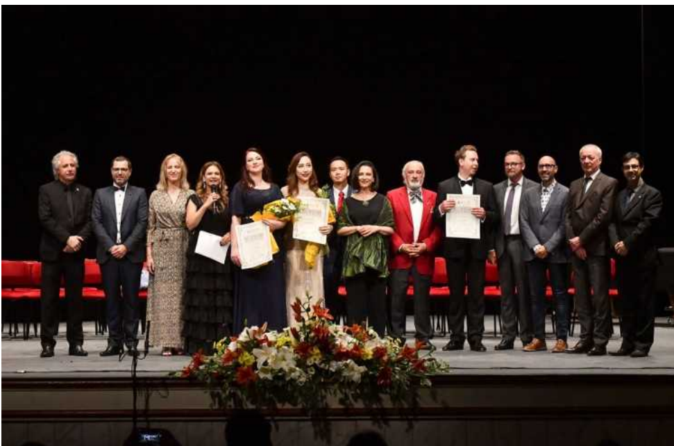
Voci Verdiane 2019