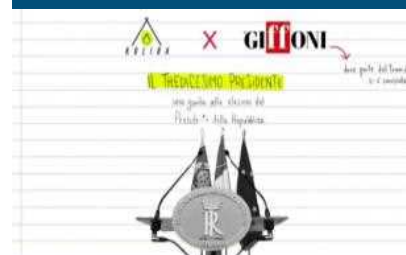
I giovani "giffoner" spiegano l'elezione presidenziale