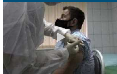
Covid, l'Austria approva l'obbligo vaccinale per gli adulti