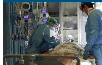
Covid, anestesisti: conteggio positivi va modificato