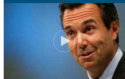
Presidente Credit Suisse lascia dopo violazione norme Covid