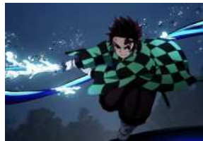
Demon Slayer – The Movie: il Treno Mugen al cinema in Campania dal 17 al 19 gennaio.