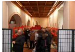
I pittori avellinesi del Diciannovesimo secolo, grande successo per la mostra al Circolo della Stampa.