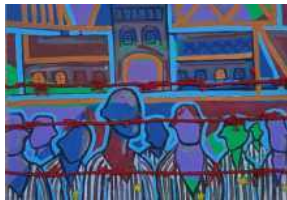
Giornata della memoria, artisti irpini a Venezia.