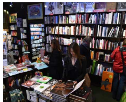
25 GENNAIO 2022