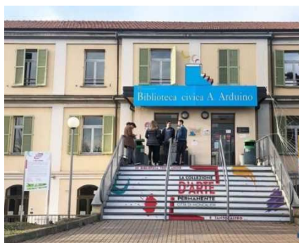
26 GENNAIO 2022