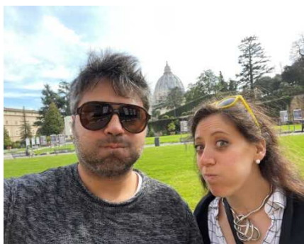
26 GENNAIO 2022