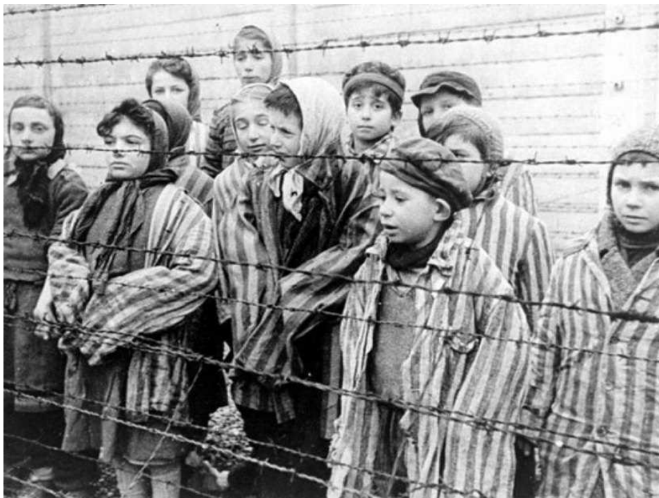
I bambini rinchiusi nel campo di sterminio di Auschwitz

Il Comune di Milano renderà pubblica la geomappa della popolazione ebraica censita a Milano nel 1938 in vista dell'emanazione delle leggi razziali fasciste; gli eventi di, Segrate, San Donato, San Giuliano e Peschiera Borromeo