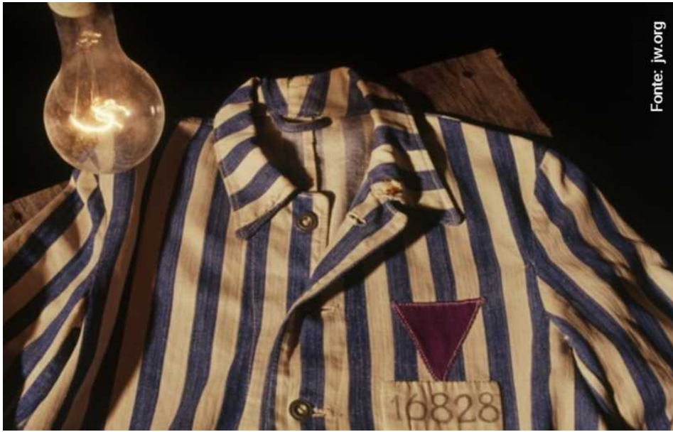
Le uniformi con i triangoli viola dei Testimoni di geova

dichiarata dalle autorità [naziste] era di eliminare completamente gli Studenti Biblici dalla storia tedesca". Si stima che morirono 1.600 Testimoni, di cui 370 per esecuzione. «La resistenza nonviolenta della gente comune di fronte al razzismo, al nazionalismo estremo e alla violenza merita una profonda riflessione in occasione del Giorno della memoria», ammoniscono in un comunicato stampa i Testimoni di Geova.