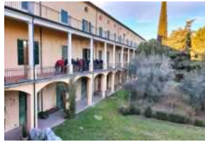
Domenica nuova visita guidata sui luoghi della memoria