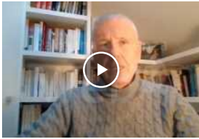
L'Associazione Nazionale Insigniti dell'Ordine al Merito della Repubblica ricorda Perlasca | VIDEO