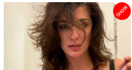
Elisa Isoardi e la "pausa forzata": «Il telefono inizia a squillare meno, i giorni passano...»

9612 - ARTICOLO NON CEDIBILE AD ALTRI AD USO ESCLUSIVO