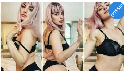
Arisa sexy su Instagram, gli scatti hot in intimo: «Ecco uno scorcio delle mie chiappe» FOTO