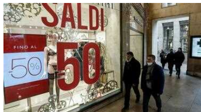
«Fate in fretta, non voglio perdere i saldi». Denunciata donna positiva al Covid: stava andando a fare shopping