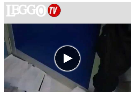
Vandali al San Camillo di Roma, l'allagamento della direzione sanitaria