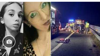
Tampona e uccide due cugine, ferendo due bambine. Poi la fuga, ma viene arrestato