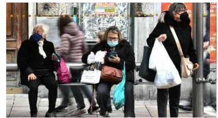
Covid, obbligo di vaccino over 50: da domani arrivano le multe