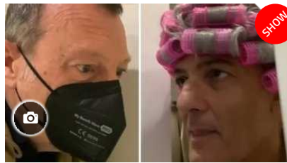
Sanremo 2022, Fiorello arriva e "gela" Amadeus: «Martedì parto, ho l'inaugurazione di una serra...»