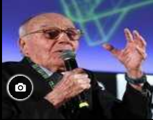
IL LUTTO Morto Tito Stagno, il giornalista Rai che raccontò lo sbarco sulla Luna. Aveva 92 anni