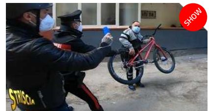
Striscia La Notizia, Vittorio Brumotti aggredito e minacciato a Licola: «Attento, la tua vita finisce!»