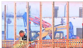
Mercoledì 09 Febbraio 2022

Lodi, il Tar sospende le autorizzazioni per il nuovo supermercato GUARDA IL VIDEO