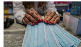
Mercoledì 09 Febbraio 2022

Vendeva prodotti senza etichette in italiano, multa da 28mila euro a un supermercato