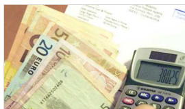
Lunedì 07 Febbraio 2022

Covid, tasso di positività al 7,6 per cento e 240 nuovi positivi nel Lodigiano