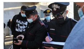
Sabato 05 Febbraio 2022

Caro-bollette, i sindaci dei piccoli Comuni lanciano l'allarme