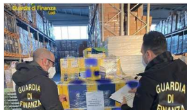
Mercoledì 09 Febbraio 2022

Lodi, il Tar sospende le autorizzazioni per il nuovo supermercato GUARDA IL VIDEO