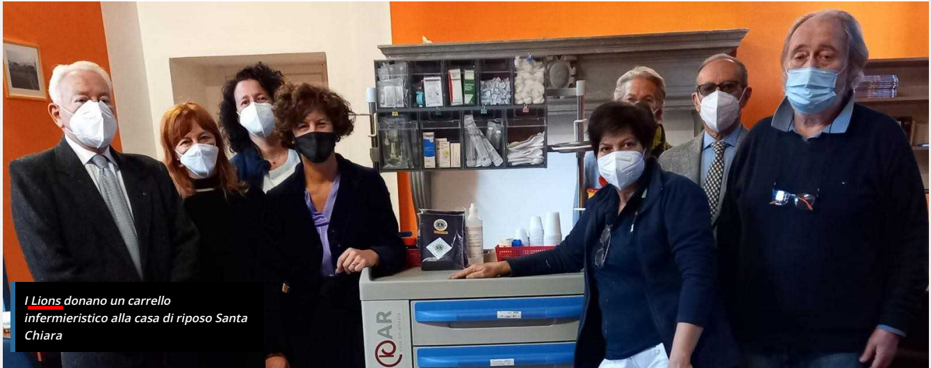
I Lions donano un carrello infermieristico alla casa di riposo Santa Chiara