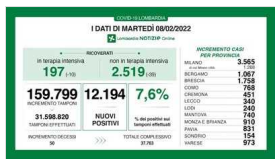
Martedì 08 Febbraio 2022

Ordinanza firmata, mascherine via da venerdì. Obbligatorie solo al chiuso fino al 31 marzo