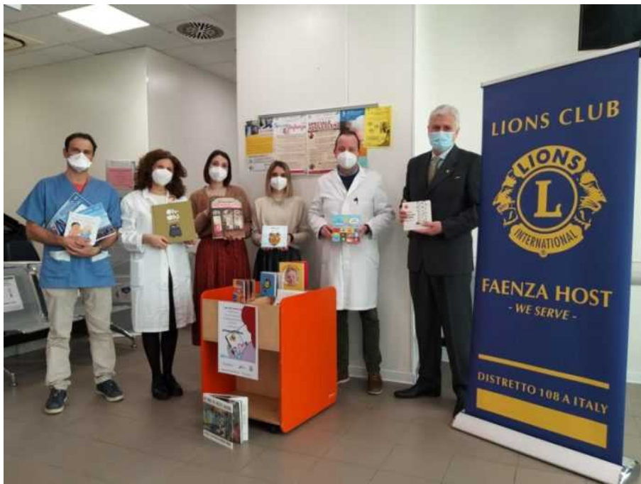
La donazione dei libri

I genitori che accedono agli ambulatori della Pediatria di Comunità di Faenza potranno da giovedì 10 febbraio condividere con i loro bambini i momenti preziosi della lettura, grazie ad una importante donazione di libri, da parte dei Lions Club Host e Leo Club di Faenza di alcuni libri selezionati. La Pediatria di Comunità sostiene il progetto "Nati per leggere" che riconosce la lettura condivisa in famiglia durante i primi 3 anni di vita come una delle azioni più importanti per favorire lo sviluppo precoce del proprio bambino. La lettura dell'adulto è un gesto di amore che nutre la mente del bambino stimolando la sua attenzione e che contribuisce allo stabilirsi di una relazione affettivamente ricca, i cui benefici perdurano nel tempo, influenzando positivamente il bambino fino all'età adulta. La lettura condivisa