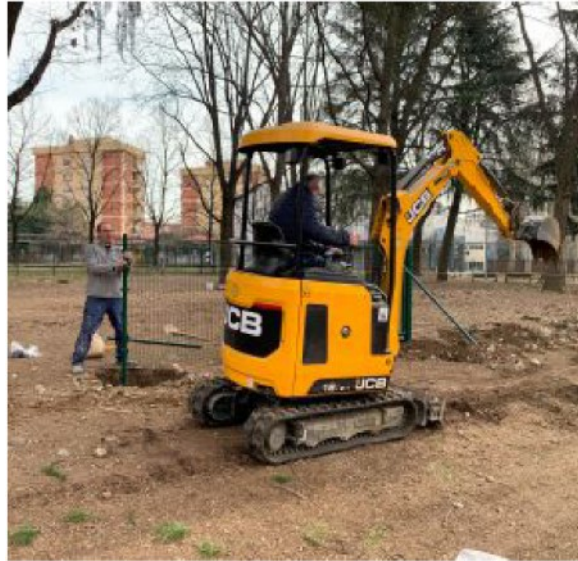
Operai al lavoro a Borsano, al Parco Brando, per sistemare l'area cani e il suo recinto ormai marcito

«Stanno creando un cancello di accesso e due ingressi laterali - spiega Tallardia - L'albero caduto è stato rimosso e si è scelto di evitare recinzioni in legno, visto che i cani