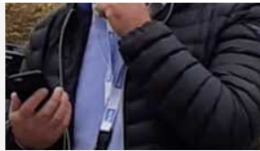
Il sindaco di Castello Fausto Tinti è andato in visita ad alcune famiglie ucraine in fuga dalla guerra

Le persone attualmente presenti nel territorio castellano sono 83, circa la metà sono bambini e l'altra metà donne. 45 alloggiano presso parenti o amici (e non hanno bisogno di successiva sistemazione), 8 sono ospiti della parrocchia di Castello e 30 sono ospitati da 10 famiglie castellane che hanno dato la disponibilità ad accoglierli temporaneamente in attesa di altra collocazione. Per questi 38 si sta organizzando il progressivo trasferimento in altri alloggi, in modo da liberare i posti di accoglienza temporanea anche in vista dei futuri arrivi.