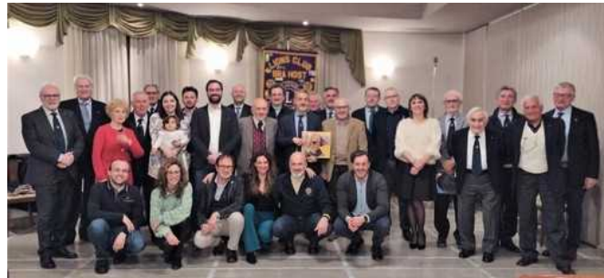
Il collettivo del Lions Club Bra Host

Al ristorante Il Principe serata di ritrovata convivialità, pensando alla solidarietà per l'Ucraina