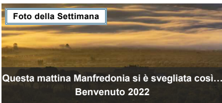
Foto della Settimana

Questa mattina Manfredonia si è svegliata così... Benvenuto 2022