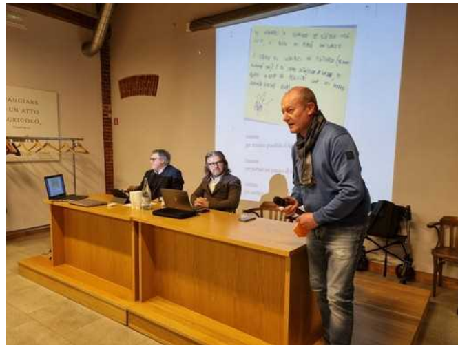
La conferenza di presentazione

La gara si terrà il 30 marzo a Eataly e ha lo scopo di regalare le vacanze a bambini e ragazze che non potrebbero farle