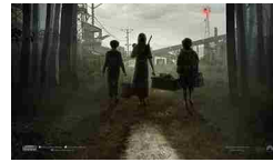
cinematografiche della settimana