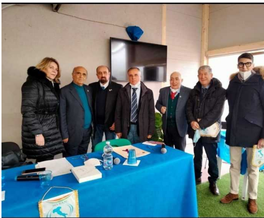
Nasce il Centro di Solidarietà Sanitaria Lions : firmato l'accordo

Luogo in cui verranno effettuate visite specialistiche a favore di persone meno abbienti e punto di riferimento per l'attuazione dei Service Nazionali sulla sclerosi e l'ambliopia