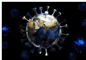
Covid. Oggi nel Ravennate 222 nuovi contagi e un decesso