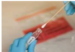
Covid, oggi 212 nuovi casi in provincia di Ravenna