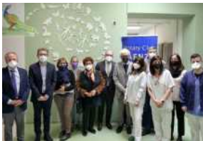
Una "Spirale della vita" in Pediatria a Faenza

Articoli correlati Altro dallo stesso autore