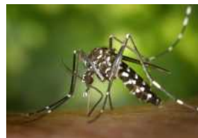
Unione: in Bassa Romagna riparte la lotta alla zanzara