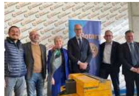
I Rotary Club a sostegno del Banco Alimentare