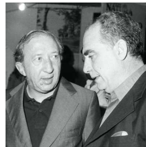
Don Giussani, e quel viaggio verso Rimini