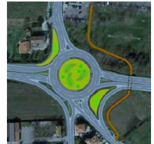
Statale 16, nella rotondona non entra la via Montescudo