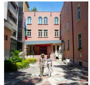
Elezioni Riccione. Fase 2, un candidato per (ri)unire