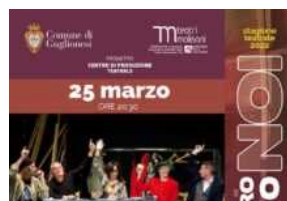
"Certi di esistere", rinviato lo spettacolo teatrale a Guglionesi