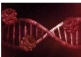
Coronavirus Molise, i dati del giorno 25 marzo 2022