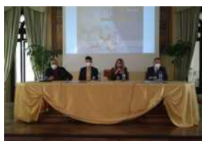
Convittadi 2022 a Campobasso: ecco quando si svolgeranno