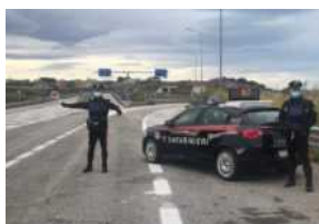
Montenero di Bisaccia, furto aggravato: arrestato uno 39enne