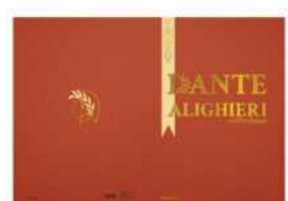
Dante, speciale cartolina e cofanetto da Poste: dove trovarli in Molise