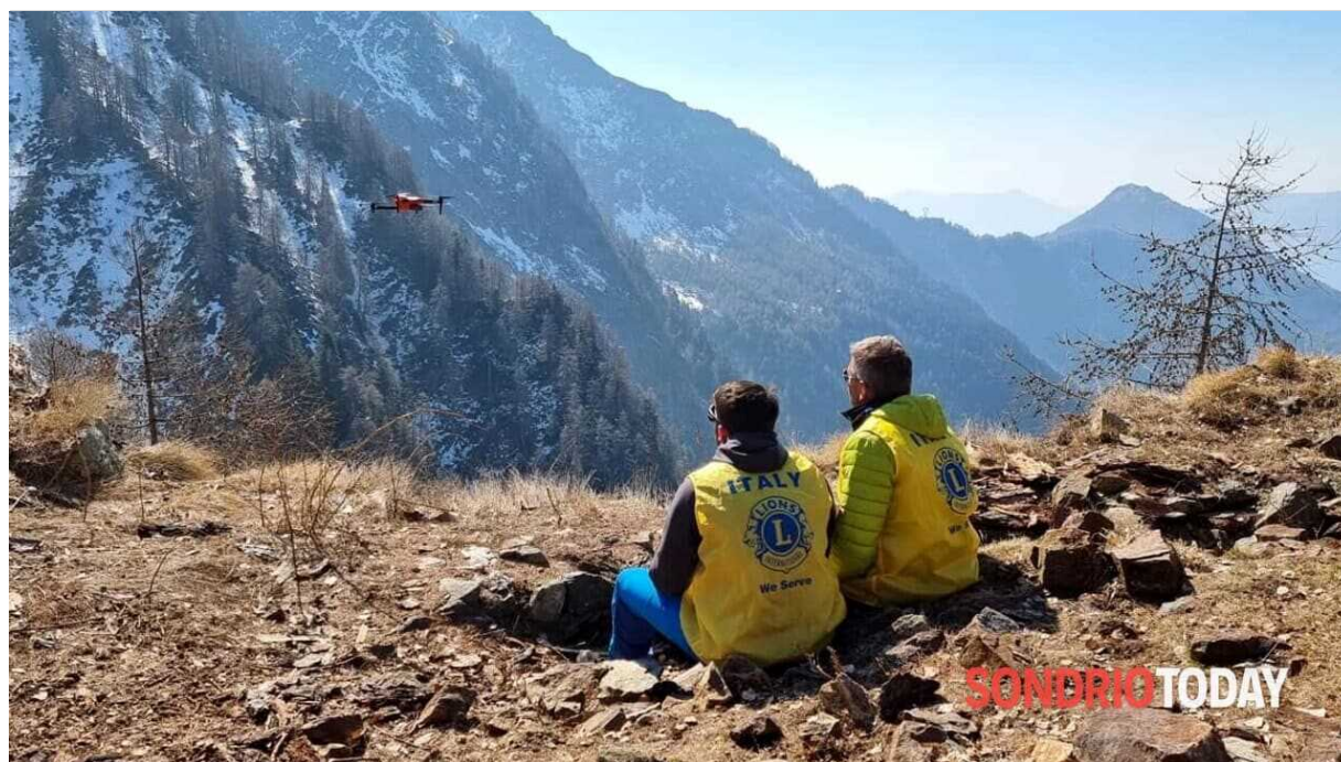
Il drone in azione sul Legnone

I Lions Club di Colico ha effettuato nei giorni scorsi un intervento coordinato dalla Procura per i rilievi dell'incidente aereo avvenuto il 16 marzo scorso sul Monte Legnone. I piloti del Lions , utilizzando il drone Modello Titan della Italdron, attrezzato per ricerca e soccorso - e dotato sia di camera ottica sia di camera termica - hanno effettuato i rilievi dei rottami in collaborazione con l'Areonautica militare e sono saliti in quota con un elicottero del Soccorso alpino della Guardia di Finanza.