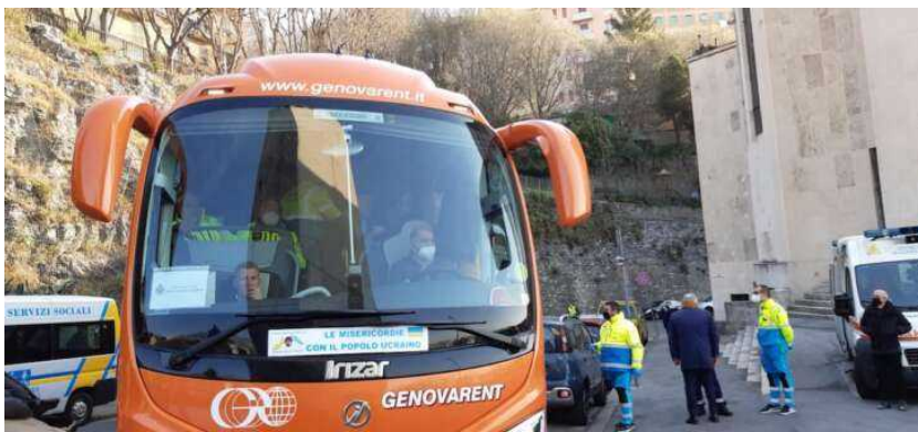
Uno dei due pullman con i profughi ucraini arrivati in via Bologna

Questa mattina alle 9 a Genova nella parrocchia di via Bologna sono arrivati i due pullman con a bordo 83 profughi ucraini, provenienti dal centro di smistamento di Korczowa, al confine fra Polonia e Ucraina.