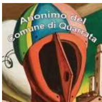
Anonimo quarratino a cena al Croce di Malta