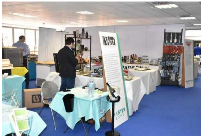
Master Expo al Palafiori di Sanremo