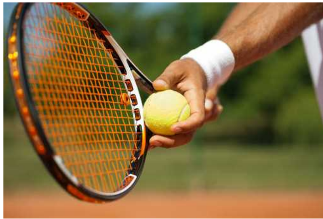
Torneo ATP Master Challenger di singolare maschile al Tennis Club Sanremo