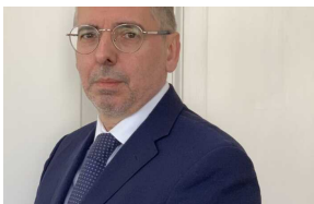
Guerra in Ucraina, Carmelos: tregua sul modello di Austria o Finlandia