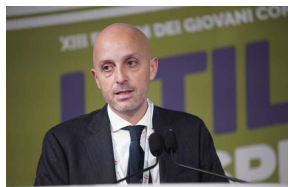
De Lise (commercialisti): La nuova figura di 'esperti' della crisi d'impresa è strategica per prevenire i fallimenti