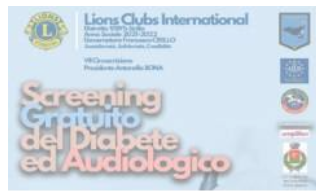
A Priolo screening gratuito del diabete e audiologico