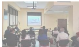
Insediato il Comitato tecnico-scientifico della Rete regionale registri tumori

SiracusaPost.it quotidiano telematico di informazione aggiornato 24 ore su 24, su notizie di politica, cronaca, economia, sport, spettacoli, cultura, enogastronomia, tecnologia, attualità.