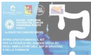
Screening oncologico per il tumore al colon retto