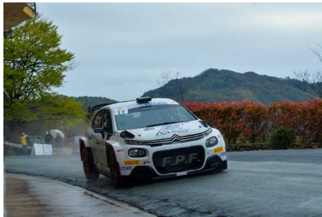
69° del Rallye Sanremo