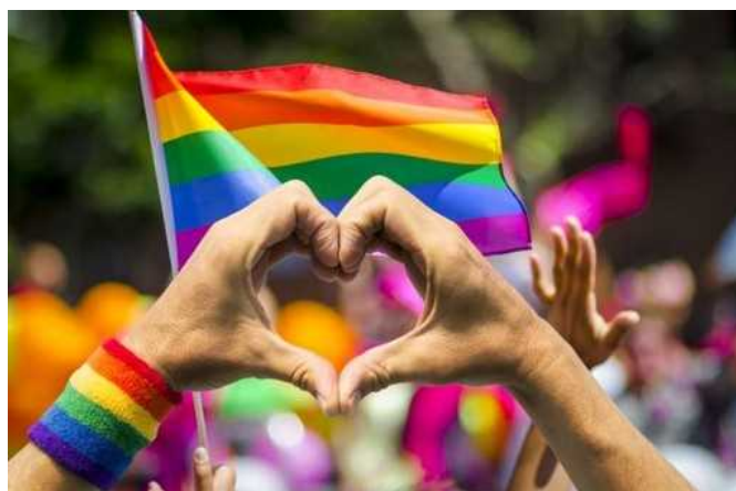
Mostra e corteo per la manifestazione del Gay Pride a Sanremo