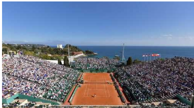
Rolex Monte-Carlo Masters at Monte-Carlo Country Club