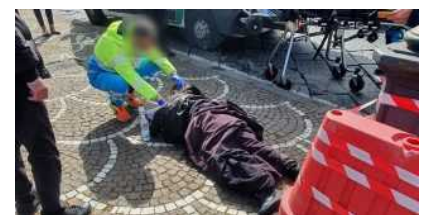
Attualità, Cronaca, Primo Piano

Pompei, scontri in centro tra giovanissimi: spuntano anche "tirapugni" e coltelli