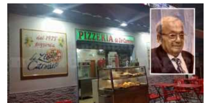
Attualità, Imprese e prodotti, Primo Piano

Pompei dice addio a Carmine Vollarò: fondò la pizzeria "da Zio Carmine"