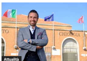
Chioggia, Mazzaro: "Valorizzare la nostra pesca è un obiettivo inderogabile"