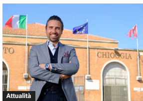
Chioggia, Mazzaro: "Valorizzare la nostra pesca è un obiettivo inderogabile"