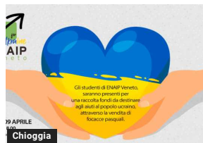
Chioggia: focacce solidali per l'Ucraina da Enaip