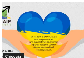
Chioggia: focacce solidali per l'Ucraina da Enaip