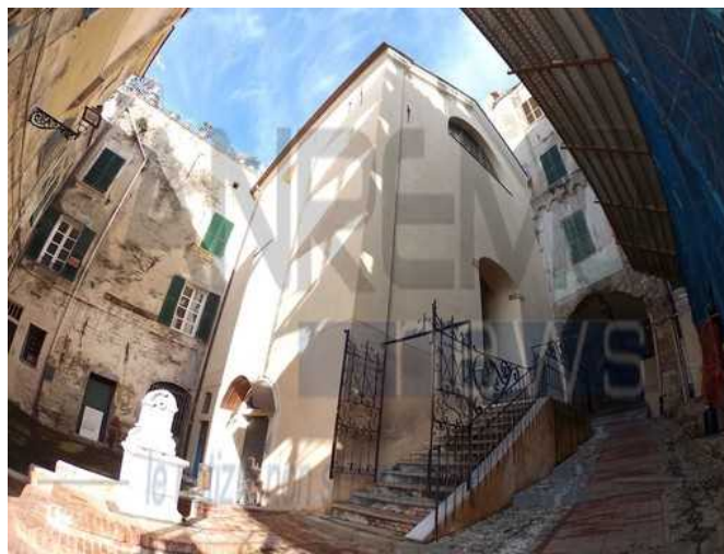
Concerto dei professori dell'Orchestra Sinfonica di Sanremo nell'ex Oratorio di S.Brigida nella Pigna