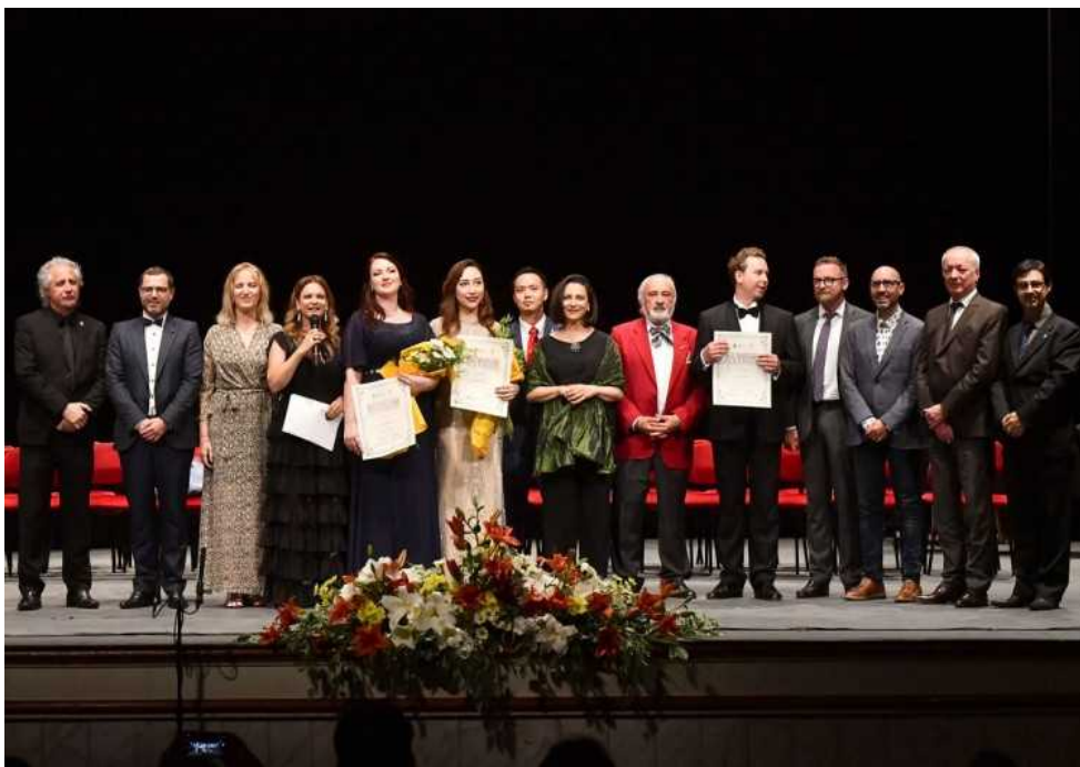
Vincitori - Voci Verdiane 2019