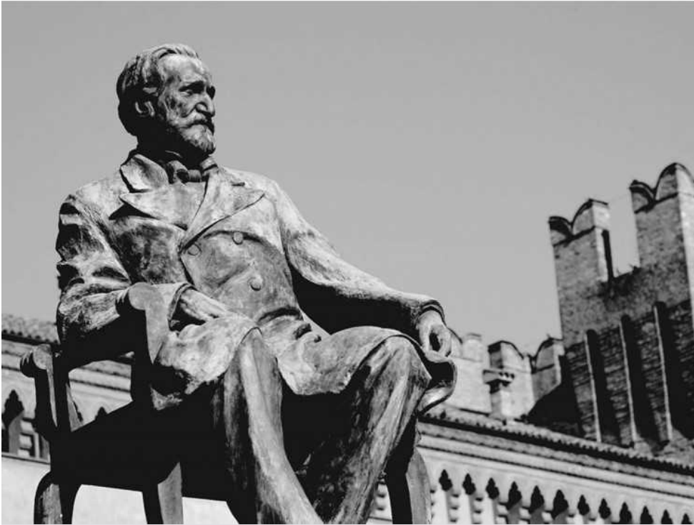
Monumento in bronzo a Giuseppe Verdi

Il 58° Concorso Internazionale Voci Verdiane Città di Busseto è realizzato con il sostegno di Ministero dei beni e delle attività culturali, Regione Emilia-Romagna, Provincia di Parma, Lions Club Busseto "Giuseppe Verdi", Verdissime.com , Fondazione Cariparma .