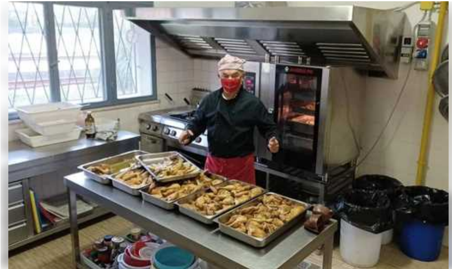
I pasti di Mensa amica, tra le realtà che hanno aderito a 'Cervia social food'

Il progetto di 'Cervia social food', al quale hanno aderito oltre trenta realtà locali, servirà a riorganizzare il mondo del volontariato