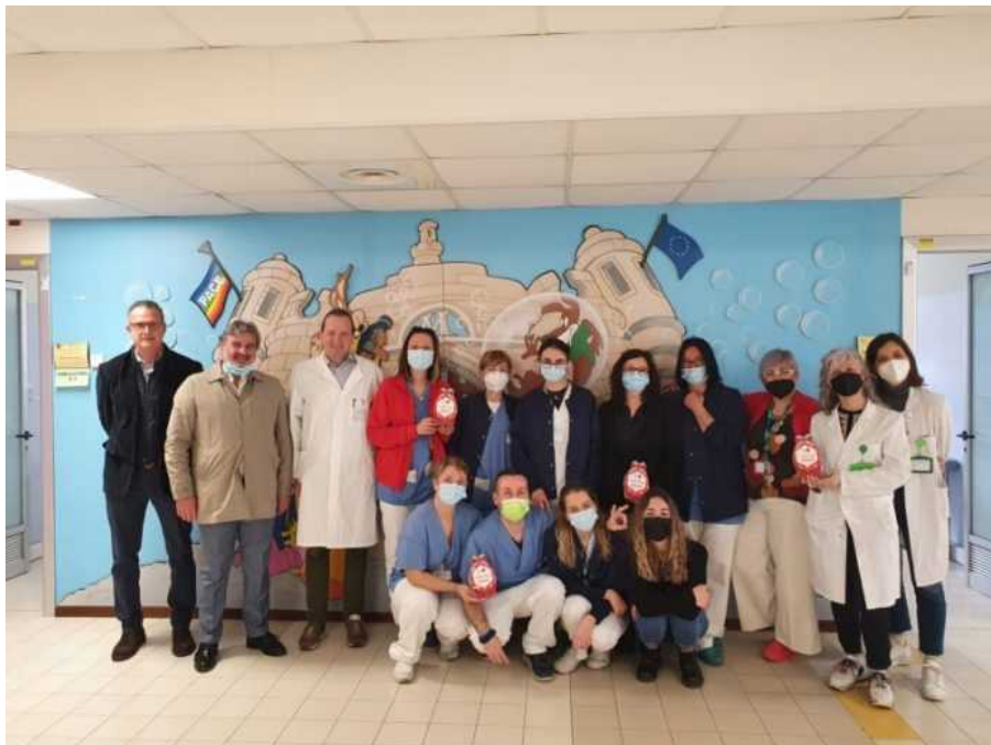
La donazione delle colombine alla Pediatria di comunità