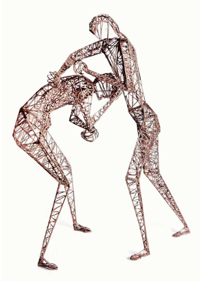
Moussa Aziz Abdayem Pugili - 1979 Filo di rame e acciaio - 64,5 x 50 x 26 cm.

In catalogo saranno presenti testi critici di Alessia Abdayem, Clotilde Paternostro, Loredana Rea, Francesca Tuscano .