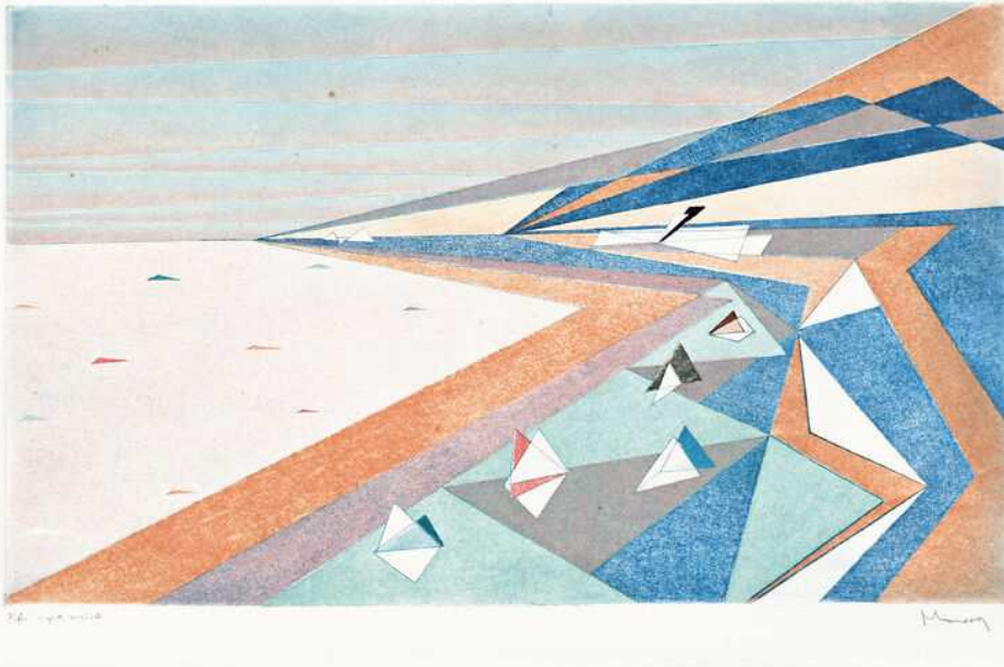
Moussa Aziz Abdayem Paesaggio - 1979 Puntasecca, punzone elettrico - 30 x 50 cm. (Prova d'Autore - copia unica)

Venerdì 29 aprile 2022, presso il Palazzo Ducale di Castelnuovo di Porto, si inaugura la mostra antologica dedicata a Moussa Aziz Abdayem (1947-2020). Artista di origine libanese, dopo una prima formazione a Beirut, si trasferisce a Roma dove si diploma in Decorazione e inizia con la "Stamperia M2M" una fertile produzione editoriale in collaborazione con alcuni dei maggiori interpreti dell'arte italiana e internazionale.