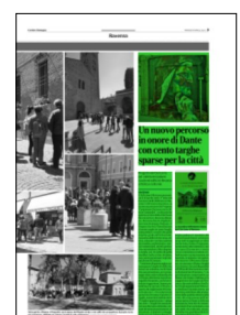
Superficie 32 %