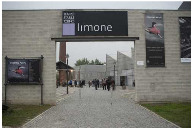
Oggi la festa dell'Unitre, domani gli 'Anni Ruggenti': alle Fonderie Limone due serate evento

A Moncalieri stasera protagonista la canzone d'autore di Fabrizio De Andrè, domani quella di Lucio Battisti