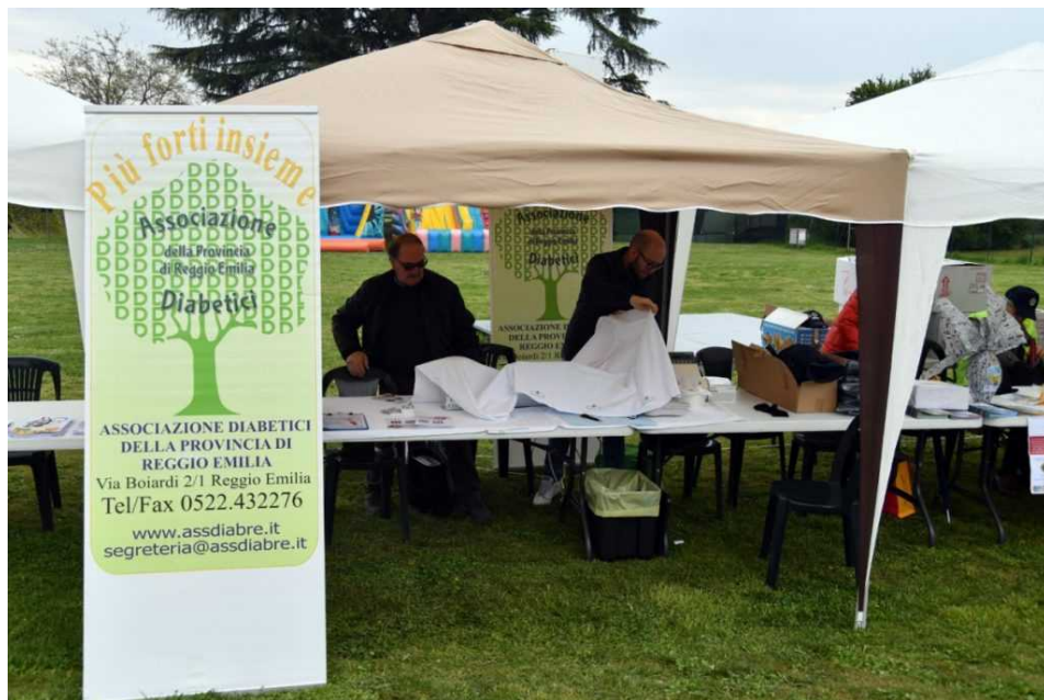
Associazione Diabetici – foto Lions Day edizione 2019

Nel pomeriggio, dalle ore 15.30, gli atleti disabili saranno impegnati a gareggiare in diverse discipline, alle 16 i cani molecolari della Protezione Civile daranno dimostrazione delle loro straordinarie abilità e, alle ore 16, è prevista anche l'esibizione dei giovani musicisti del gruppo "Tetra Saxophone Quartet" che allieteranno il pubblico con un repertorio che spazia dalla musica Barocca al Novecento, alla musica da film.