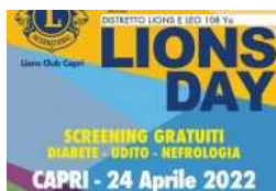
Lions Day a Capri