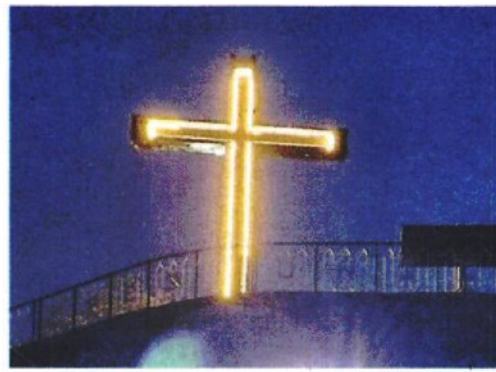
La croce davanti al santuario della Madonna di Pietraquaria in cima al Monte Salviano

ARTICOLO NON CEDIBILE AD ALTRI AD USO ESCLUSIVO DEL CLIENTE CHE LO RICEVE - 9612