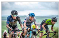
Eroica Juniores – Coppa Andrea Meneghelli