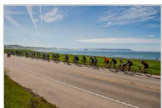
NOVA Eroica California