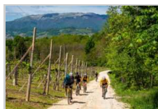
NOVA Eroica Prosecco Hills