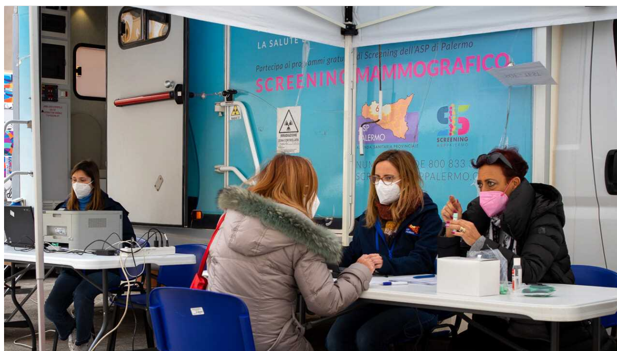
Gli screening dell'Asp

G rande successo in Sicilia per l'iniziativa "Screening di primavera" promossa dall'assessorato regionale della Salute nell'ambito del protocollo d'intesa con Lions Club International, coordinato dal Servizio 1 - Screening oncologici dell'assessorato e dall'Ufficio speciale comunicazione, e realizzato dalle Aziende sanitarie provinciali- e dai volontari di Lions distretto 108Yb. L'iniziativa si è svolta anche a Palermo, in piazza Castelnuovo.