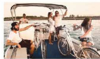
Lignano-Bibione: Torna il passo barca e le altre linee marittime