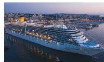
Costa crociere riparte da Trieste e tornano le escursioni libere in città