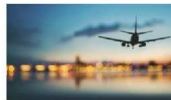
Nuove regole per volare