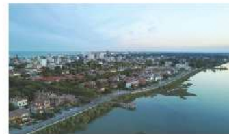
Lignano Sabbiadoro confermata tra le Tree Cities of the World