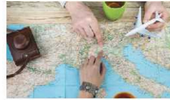
Prorogato al 1 agosto il bando Fondo turismo in FVG