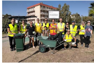
Raccolta di rifiuti lungo la pista ciclabile: in azione il Lions Club Vasto New Century

Altro su: casalbordino , Lions Club Vasto New Century