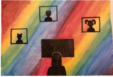
Lions Club Vasto New Century , concluso il service dedicato ai disegni sul tema della Pace