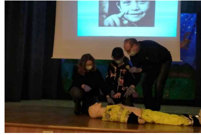
Il primo soccorso al centro di "Viva Sofia!", nuovo service dei Lions Club vastesi