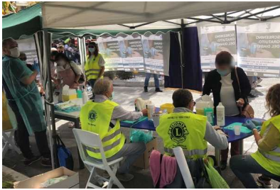
Diabete, effettuati oltre 300 controlli nella campagna di screening dei tre Lions Club vastesi